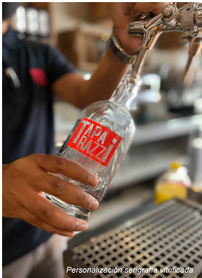
Personalización serigrafía vitrificada