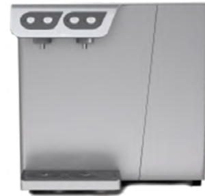
INFINITY PRO LATERAL